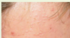
Comédons fermés (microkystes)