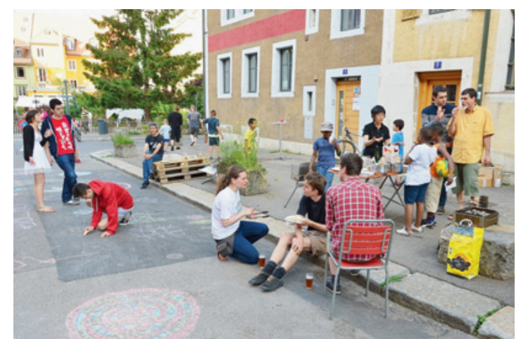
La Fête des voisins à la rue de la Serre en 2014.

La fin des inscriptions est pour ce matin, mais la Ville signale que le matériel offert en prêt, tables et bancs surtout, est sur le point d'être livré. Avec ça, les automobilistes doivent donc s'attendre à ce que des tronçons de rue soient fermés à la circula-