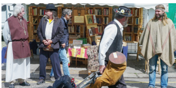
Un marché à la sauce chaux-de-fonnière surgi du passé.