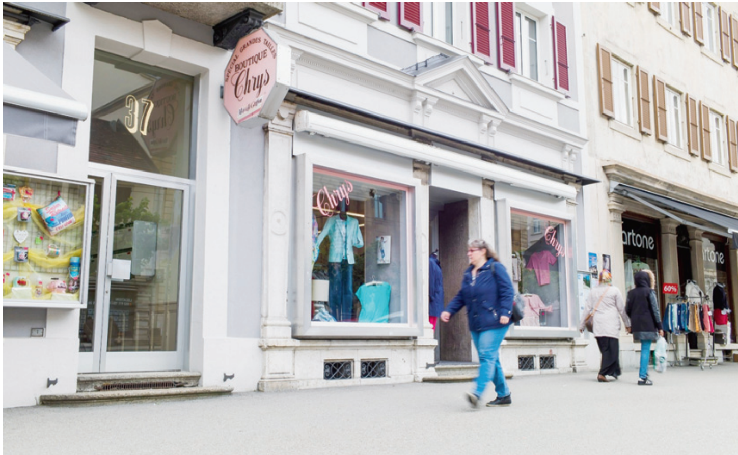
La boutique Chrys est l'une des enseignes qui a rejoint le dispositif Proxipass développé pour relancer le commerce de proximité.

Proxipass? «L'opportunité pour les clients de bénéficier de 10% de rabais sur tous leurs achats pendant les dix jours suivant leur anniversaire. Et ce dans l'ensemble des enseignes qui se sont jointes au système», ex-