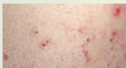
Comédons ouverts (points noirs)