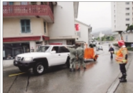
L'ARMÉE EN RENFORT Les militaires ont débarqué à Delémont avec un 4 x 4 et une remorque sécurisée en vue de transporter les deux obus et les faire exploser dans un lieu situé loin du Jura.

Delémont, rue des Moulins No 17. Quasiment en bas du cras du Moulin, comme ils disent dans le chef-lieu. Occupés hier à des travaux d'isolation, des ouvriers font une drôle de découverte. Dans un faux plancher, à la hauteur du grenier d'une propriété, ils mettent la main sans le vouloir sur du matériel de guerre. Il est aux environs de 14 heures et la police est alertée. Elle ne mettra même pas cinq minutes pour se rendre sur les lieux.